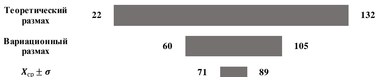
Рисунок 1 – Распределение испытуемых по критерию толерантности

Таким образом, мы можем полагать, что результаты диагностики соответствуют реальному распределению психологической особенности «толерантность» исследуемой выборке студентов гуманитарного профиля. Типичные для распределения показатели ( 80 \pm 9 ) полностью укладываются в область средних значений толерантности, коэффициент вариации составляет 11%, поэтому мы можем констатировать, что студенты гуманитарного профиля демонстрируют сочетание толерантных и интолерантных черт. Вероятность и интенсивность проявления интолерантности варьируется в зависимости от того, к какому из двух полюсов (толерантности или интолерантности) ближе индивидуальный показатель. А именно, 23 человека (49% выборки) имеют либо низкий уровень толерантности, либо ситуативно обусловленный с тенденцией к интолерантности. Остальные 24 человека (51% выборки) соответственно – либо высокий уровень толерантности, либо ситуативно обусловленный с тенденцией к толерантности.