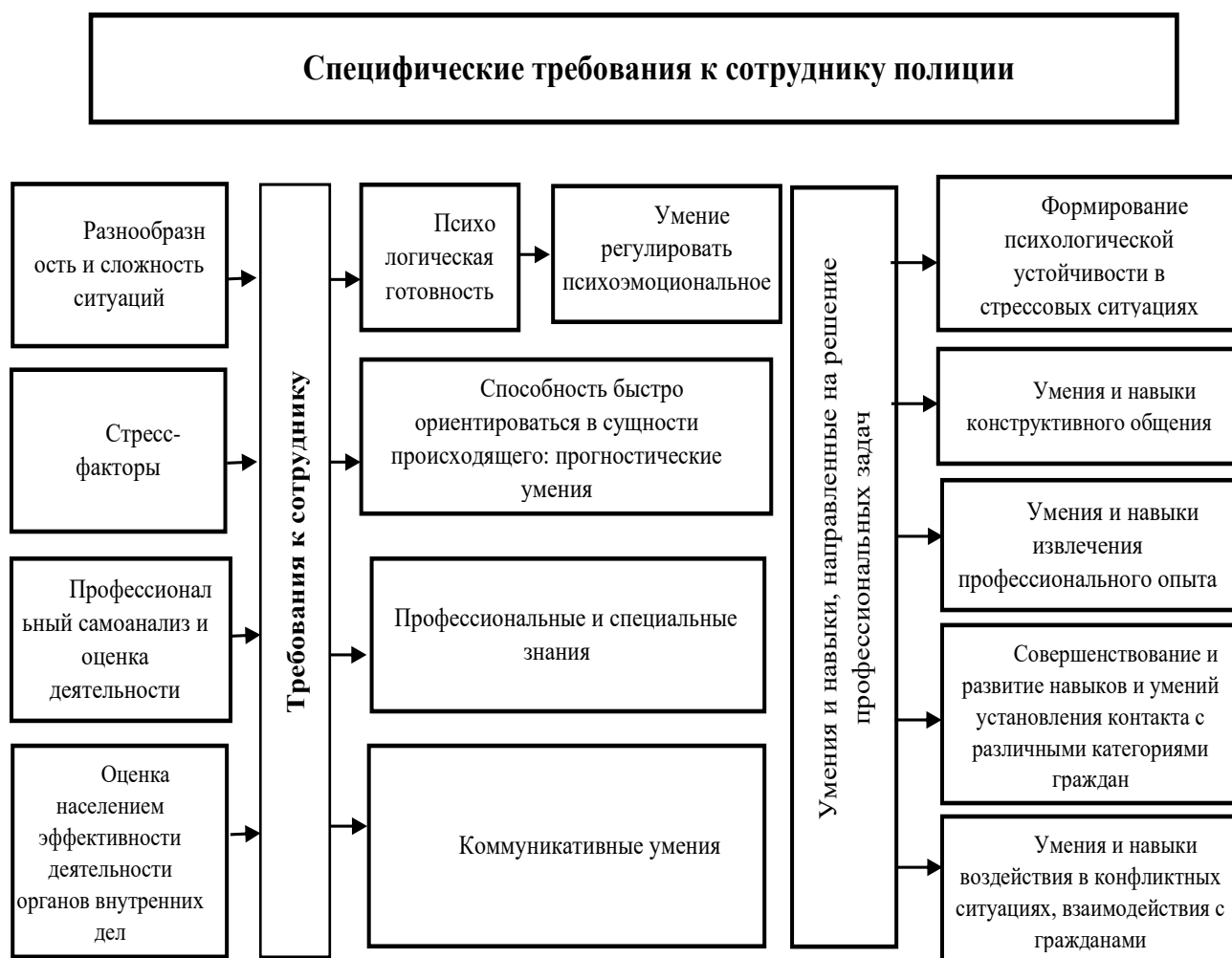
Рисунок 1 - Специфические требования к сотруднику полиции

Стоит отметить специфику зачисления на службу в органы внутренних дел. Подбор кандидатов осуществляется после проведения испытания, которое включает в себя профессиональный психологический отбор, медицинское освидетельствование и оценку физической пригодности. В профессиональный психологический отбор входит психологическое и психофизиологическое обследование, направленное на получение объективных данных о личностных качествах кандидата, необходимых для успешного обучения и последующей служебной деятельности в органах внутренних дел, и индивидуальных особенностях проявлений его психики. По результатам медицинского освидетельствования определяется годность кандидата к службе в полиции (см. Постановление Правительства РФ от 6 декабря 2012 г. № 1259). Оценка пригодности кандидата проводится с целью проверки его готовности к специфике службы в органах внутренних дел (рис. 1).