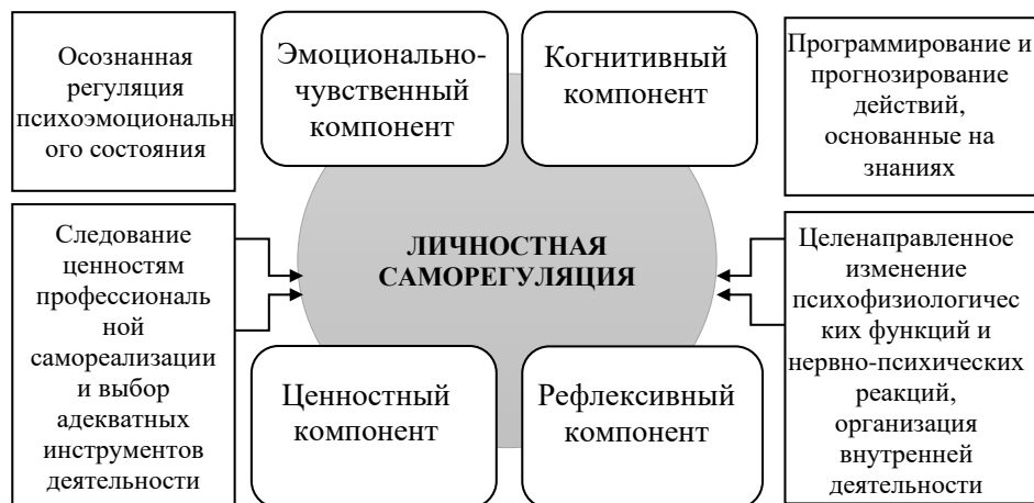
Рисунок 3 - Компоненты личностной саморегуляции