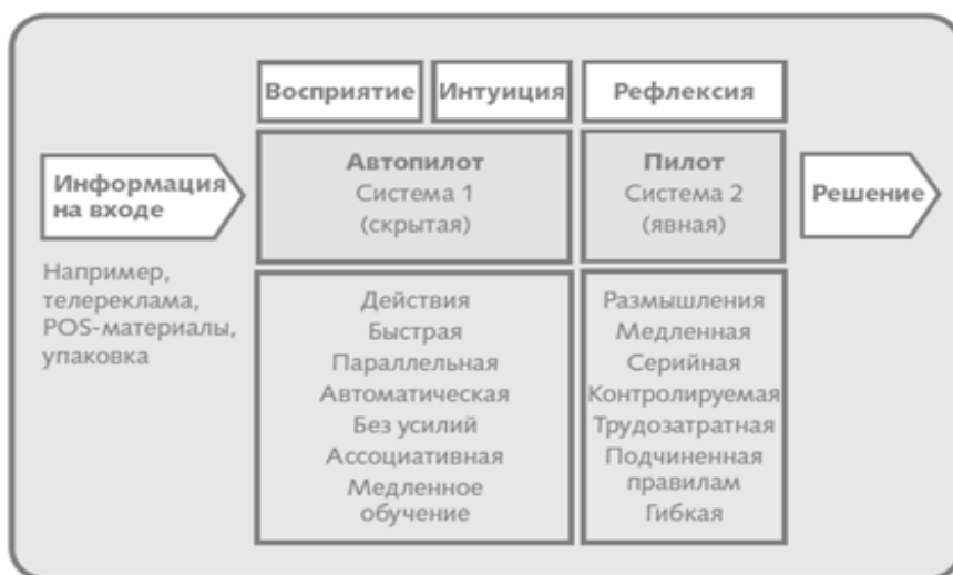
Рисунок 1 – Типы когнитивных процессов Д. Канемана

является мониторинг качества как мыслительных процессов, так и очевидного поведения. В силу его неопределенности и медлительности, появляется множество интуитивных суждений, в том числе и ложных. И их тем больше, чем проще объект восприятия. Важным для теории экономического выбора является вывод, что при наличии опыта и дефиците времени система 2 вообще не работает и решения принимаются интуитивно. Впечатления, порождаемые системой 1 управляют суждениями и умозаключениями до тех пор, пока не трансформируются или не отвергаются сознательными процессами системы 2.