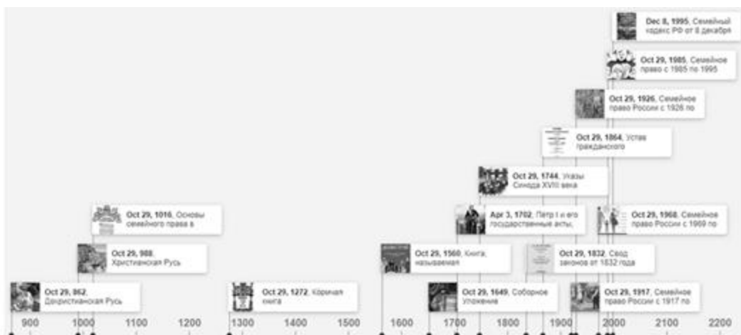
Рисунок 1 - Основные этапы становления семейного права России