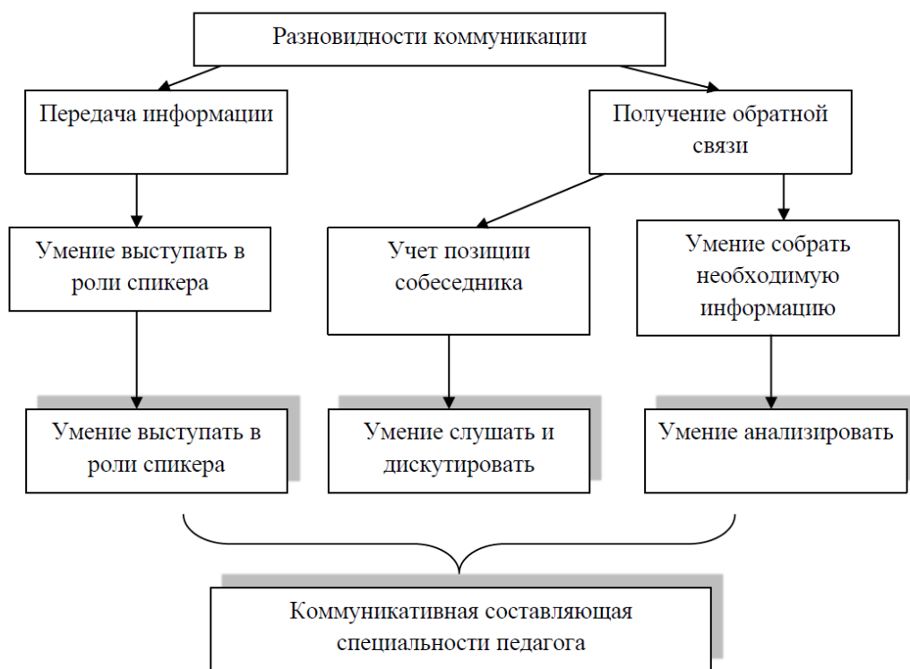
Рисунок 1 - Схема, представляющая собой классификацию коммуникаций и влекомые с этой компетенции умения педагога

свободно и не бояться проявлять свое «я» - позволят им быстро и качественно усваивать знания и стремиться к саморазвитию.