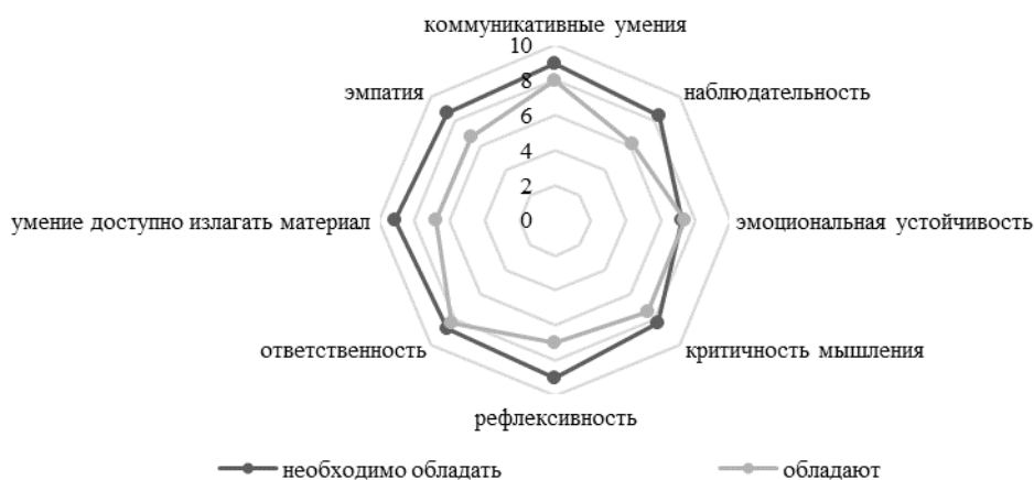
Рисунок 1 – Результаты данных опроса обучающихся 2-4 курсов

процесса, а также факторов, влияющих на процесс формирования профессионально важных качеств специалиста по информационной безопасности в ходе профессиональной подготовки.