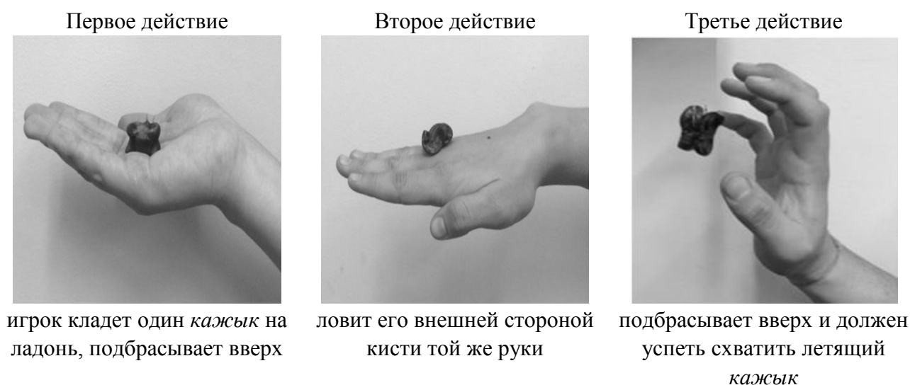
Рисунок 2 - Игра «ловить коня»: подбрасывание и ловля «кажык»

Игра в кости является традиционно тувинской, она имеет несколько разновидностей: отгадывание – «бодалажыры», ловля астрагалов – «чыттырып кагары», «скачки» – «аът чарыштырары», «стрельба в «косули» – «адып ойнаары» и другие [там же].