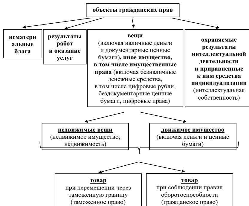
Рисунок 1. Место правового понятия «товар» в объектах гражданских прав и понятия «товар» в таможенном праве

С учетом вышеизложенного, определение понятия «товар» в таможенном праве отличается от гражданско-правового определения лишь в том, что в таможенном праве понятие «товар» неразрывно связано с фактом его перемещения через таможенную границу, а в гражданском праве – с фактом перехода на него права собственности. При этом родовое понятие «имущество» остается единым, гражданско-правовым, для обеих категорий.