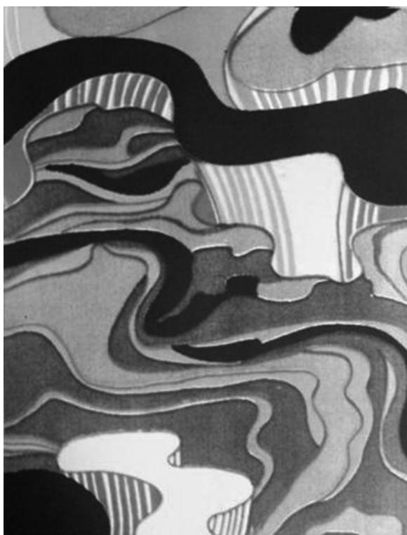
Рисунок 6. Узор ткани с мотивами органической пластики, 1970-е гг. [Морозова, Щербакова, 2015, 12]