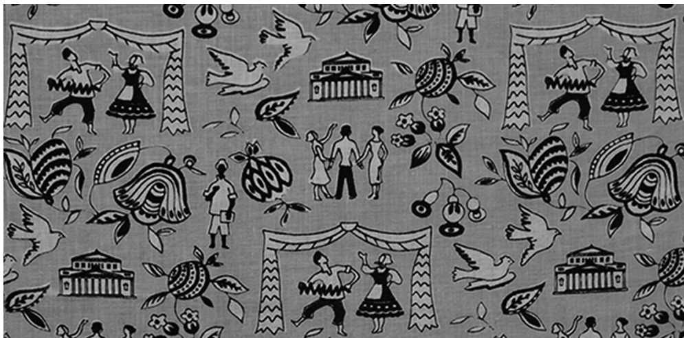
Рисунок 8. Шумяцкая Е.А. Эскиз платка. Трехгорная мануфактура им. Ф.Э. Дзержинского. 1957 г. На ткани мотивы, олицетворяющие новую Москву 3

творческие эксперименты. Принципы производства и художественные приемы, основанные в период 1950–1970-х годов, используются и сегодня в отечественном текстильном дизайне. Важным качеством, которое осталось от требований 1970-х годов, осталось «чувство современности».