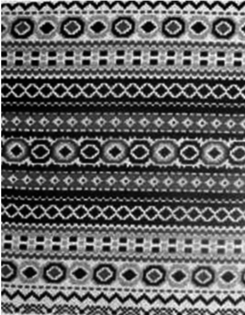
Рисунок 3. Рисунки по мотивам народного искусства, 1950-е годы. Трехгорная мануфактура [Морозова, Щербакова, 2018, 7]

В середине и конце 1960-х возрос интерес художников по ткани к народному искусству: имитировались русская вышивка, кружево, резьба по дереву. Е.Шумяцкая на комбинате «Трехгорная мануфактура» одна из первых обратилась к фольклору в начале 1950-х; на той же фабрике народные мотивы разрабатывали М. Хвостенко, Е. Шаповалова. Эти мотивы были поначалу довольно простыми имитациями вышивок и ткачества: «орнаменты мелкого и среднего масштаба, повторяющие строй и характер украинских, молдавских, русских, грузинских и других народных орнаментов» [Морозова, Щербакова, 2018, 7] (рис. 3).