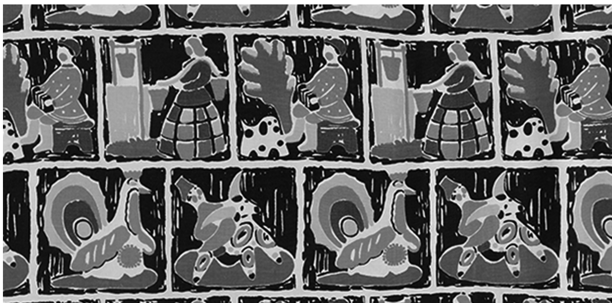
Рисунок 4. Шумяцкая Е.Я. Декоративная ткань «Вятская игрушка». Шёлкоткацкая фабрика «Красная роза» им. Розы Люксембург. 1957 г 1

Важно отметить, что народные мотивы служили своего рода «противовесом» «буржуазным» тенденциям в моде; активно разрабатывались как модели, так и орнаменты в фольклорном стиле [Виниченко, 2010, 44].