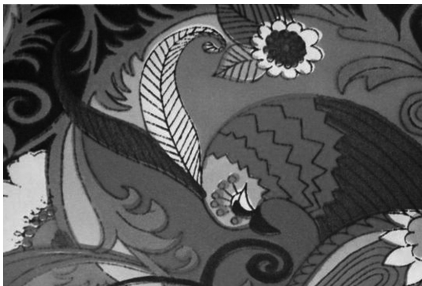
Рисунок 2. Набивной орнамент с мотивом «восточного огурца». Первая Московская ситценабивная фабрика, середина 1970-х гг. [Морозова, Щербакова, 2015, 11]

Очевидно, что влияние хиппи и эпохи психоделики испытал и такой сравнительно традиционный для русского текстиля мотив, как «огурцы»: он стал ярче и фантазийнее (рис. 2). Несколько угасший в конце 1950-х– начале 1960-х, он возродился в середине 1960-х годов в новых цветах [Савина, 2016, 166].