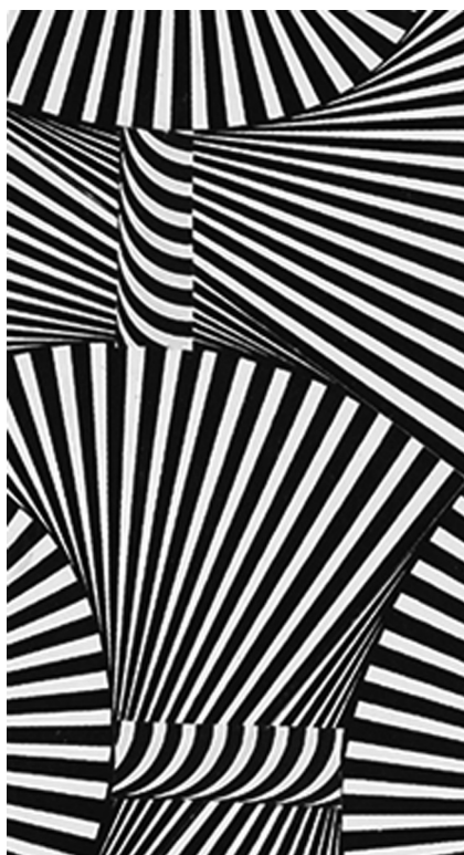
Рисунок 5. Рубцова Л.П. Геометрический узор с оптическими иллюзиями. Шелкоткацкая фабрика «Красная роза», 170–180-е гг. 2