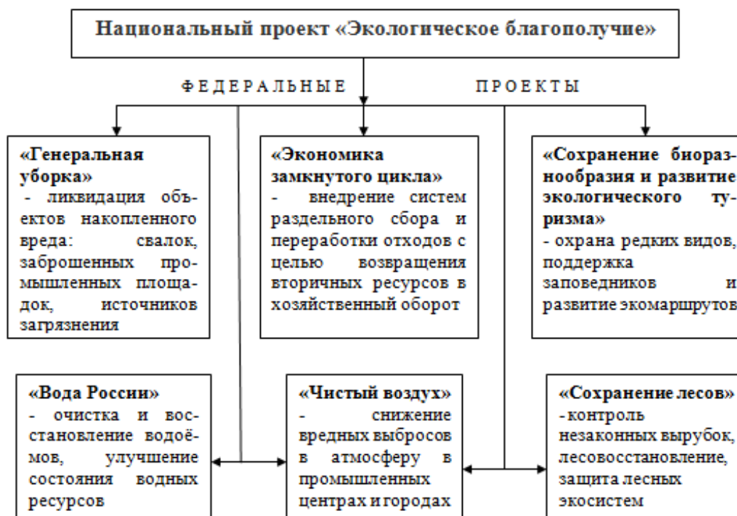
Рисунок 3 — Состав федеральных проектов в рамках национального проекта «Экологическое благополучие»

С 1 января 2025 года в России стартовал национальный проект «Экологическое благополучие», на смену прежнему нацпроекту «Экология». Национальный проект включает в себя шесть федеральных проектов (рис. 3), каждый из которых отвечает за конкретную сферу экологической политики и способствует достижению Россией целей в области устойчивого развития.