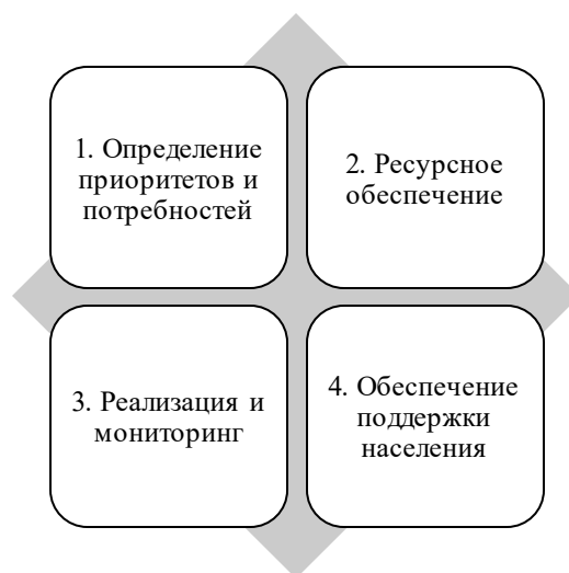
Рисунок 1 – Целевые направления реализации национальных проектов в регионах

Роль регионов в системе управления стратегическими проектами государства многогранна и высока. Однако она может ограничиваться неопределённостью и непредсказуемостью внешних факторов, влияющих на устойчивое развитие и экономику региона [Трубин, 2022]. При этом региональная реализация национальных проектов охватывает несколько ключевых моментов, показанных на рисунке 1.