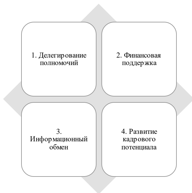
Рисунок 3 – Модель взаимодействия федеральных и региональных властей при реализации национальных проектов

Модель взаимодействия федеральной и региональных властей, отображенные на рисунке 3 предполагают выполнение следующих условий: