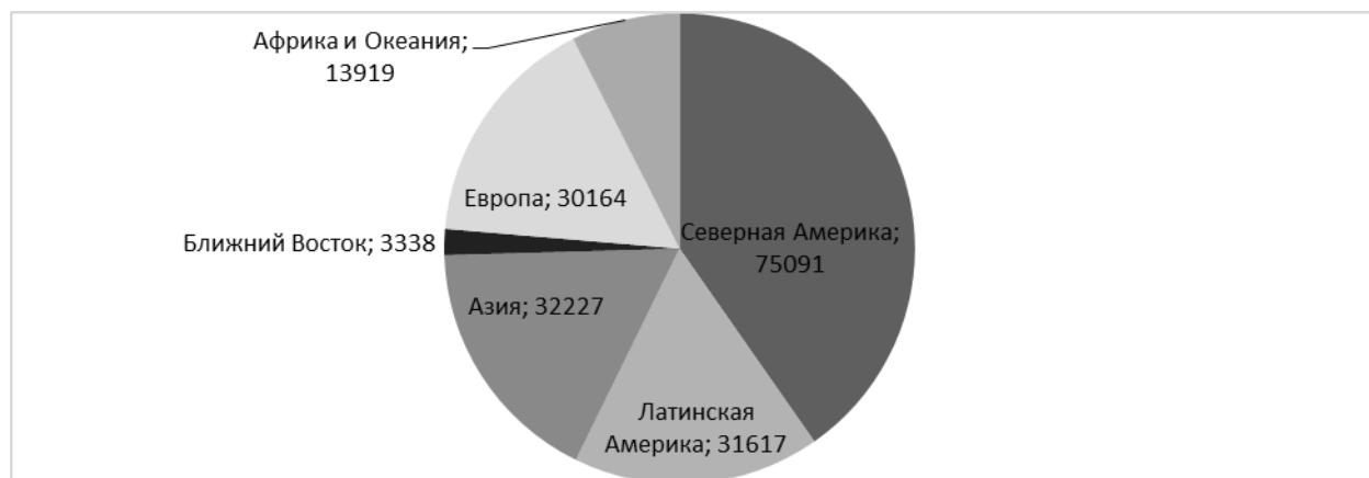
Рисунок 1 - Распределение прямых зарубежных инвестиций Японии по регионам мира в 1989 г. [Спандарьян, 1991, 134]

штатах из 50 [Спандарьян, 1991, 152]. Влияние японских капиталов было ощутимо не только в США, но и в других регионах мира: больше всего в Северной Америке и Юго-Восточной Азии [там же, 134]. (рис. 1).