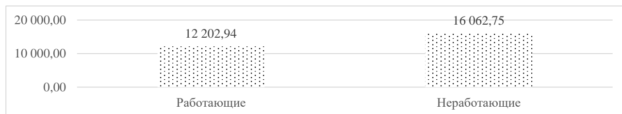
Рисунок 2 – Среднемесячная пенсия в Карачаево-Черкесской Республике в разрезе занятости пенсионера на конец 2021 года, руб. [Средний размер пенсии в номинальном ..., 2022]

Показатель отличается в зависимости от того, продолжает ли застрахованное лицо свою трудовую деятельность. Если речь идет о неработающем пенсионере, то соответствующий показатель составляет около 16 063 руб. в месяц, а для работающих такой показатель равен 12 203 руб. в месяц (Рисунок 2).