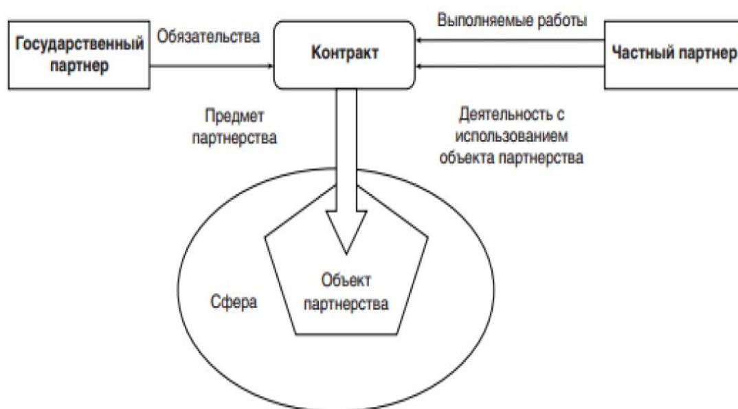
Рисунок 2 – Механизм организации взаимодействия государственного и частного партнеров в рамках реализации проектов на принципах ГЧП [Шкред, Мурзин, 2020]

Принципиальный механизм организации взаимодействия государственного и частного партнеров в рамках реализации процедуры ГЧП может быть представлен в следующем виде (рис. 2).