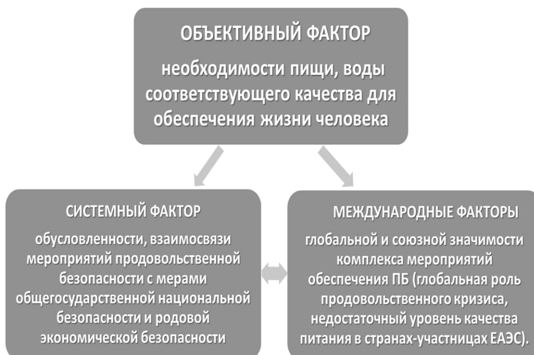
Рисунок 1 - Факторы важности исследования вопросов продовольственной безопасности

Таким образом, решение проблем обеспечения в России продовольственной безопасности не представляется возможным без вычисления объема исследований, посвященных вопросу продовольственной безопасности, и отражения широкого спектра позиций российских экономистов по подходу к понятию продовольственной безопасности. Данное исследование предпринимает попытку пролить свет на указанные выше позиции.