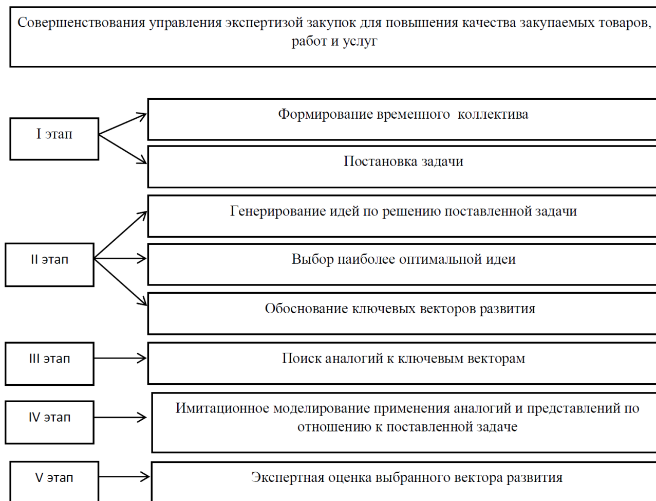
Рисунок 4 - Алгоритм принятия управленческого решения для совершенствования управления экспертизой закупок для повышения качества закупаемых товаров, работ и услуг