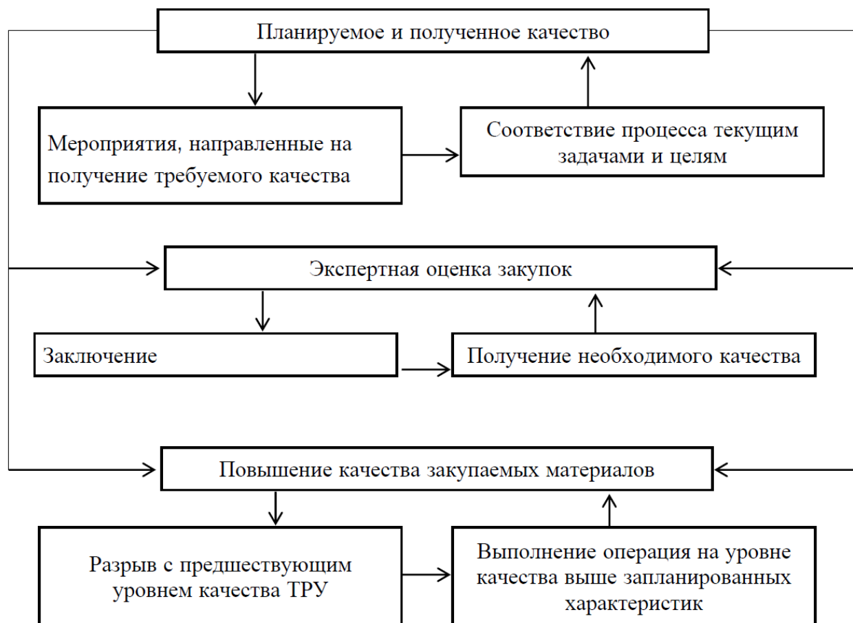
Рисунок 2 – Триада качества по Дж. Джурану