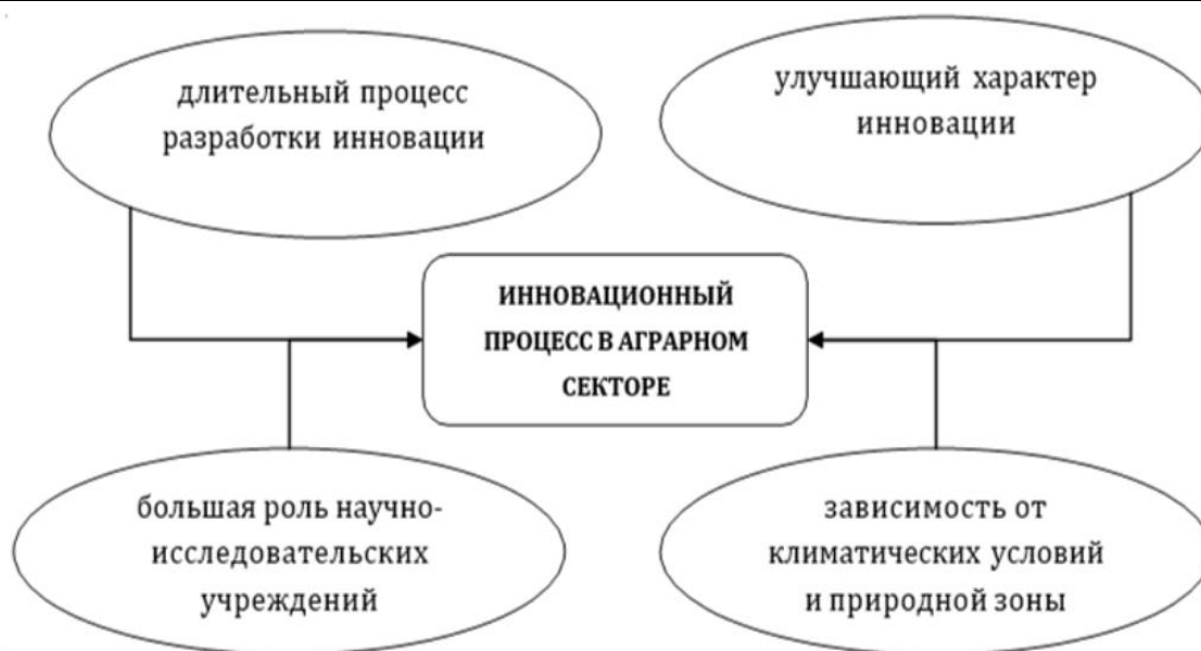
Рисунок 1 - Особенности инновационного процесса в аграрном секторе

Выделяются три основных направления внедрения инноваций в деятельность сельскохозяйственных предприятий, представленных на рис. 2. К ним относятся инновации в сфере человеческого фактора, биологического фактора и техногенного фактора.