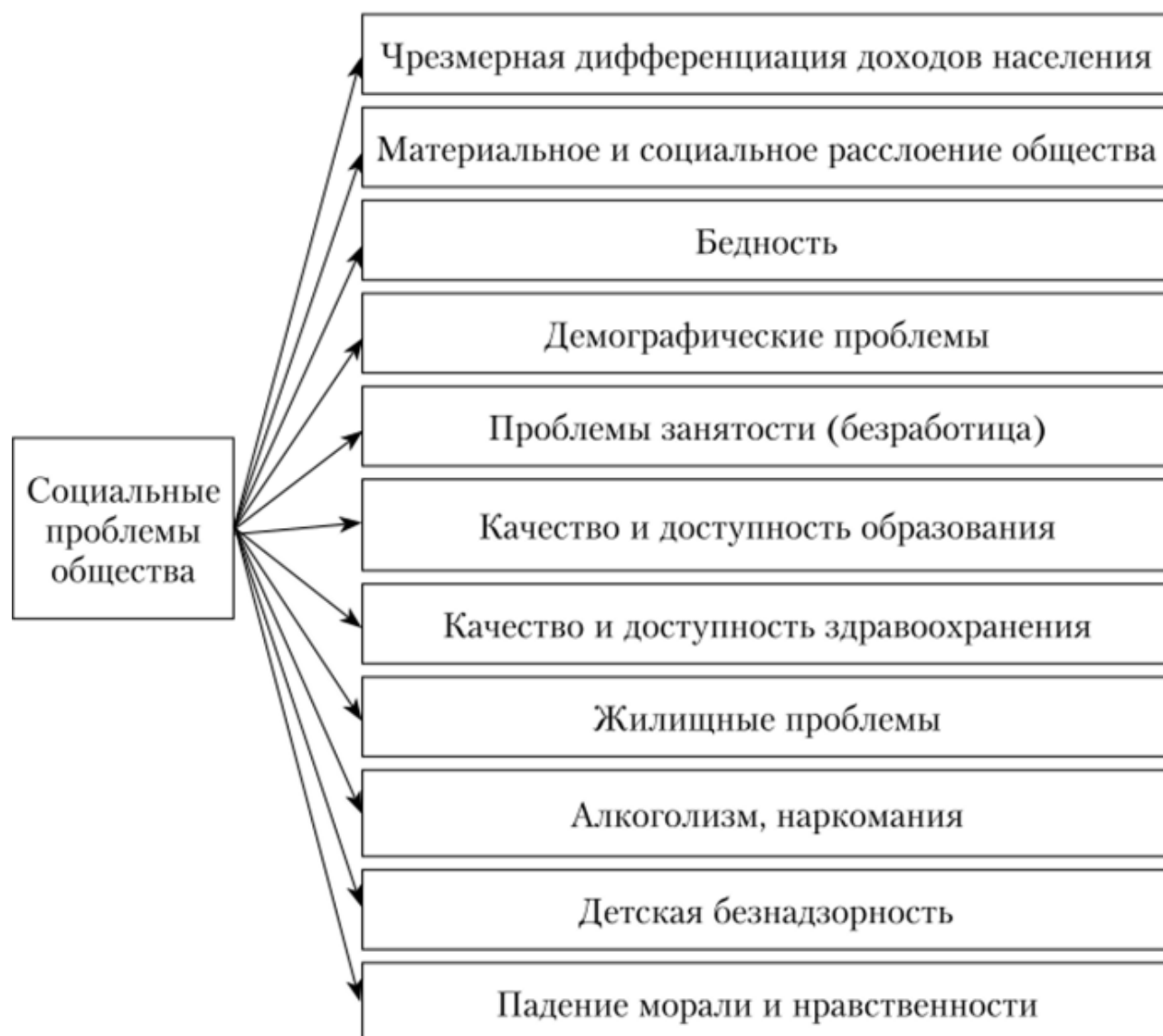
Рисунок 1 - Основные социальные проблемы, характерные для современного российского общества [Канаев, 2020]

конкретной территории в целом. При этом решение комплекса социальных проблем является одной из ключевых задач, реализуемой на соответствующем территориальном уровне.