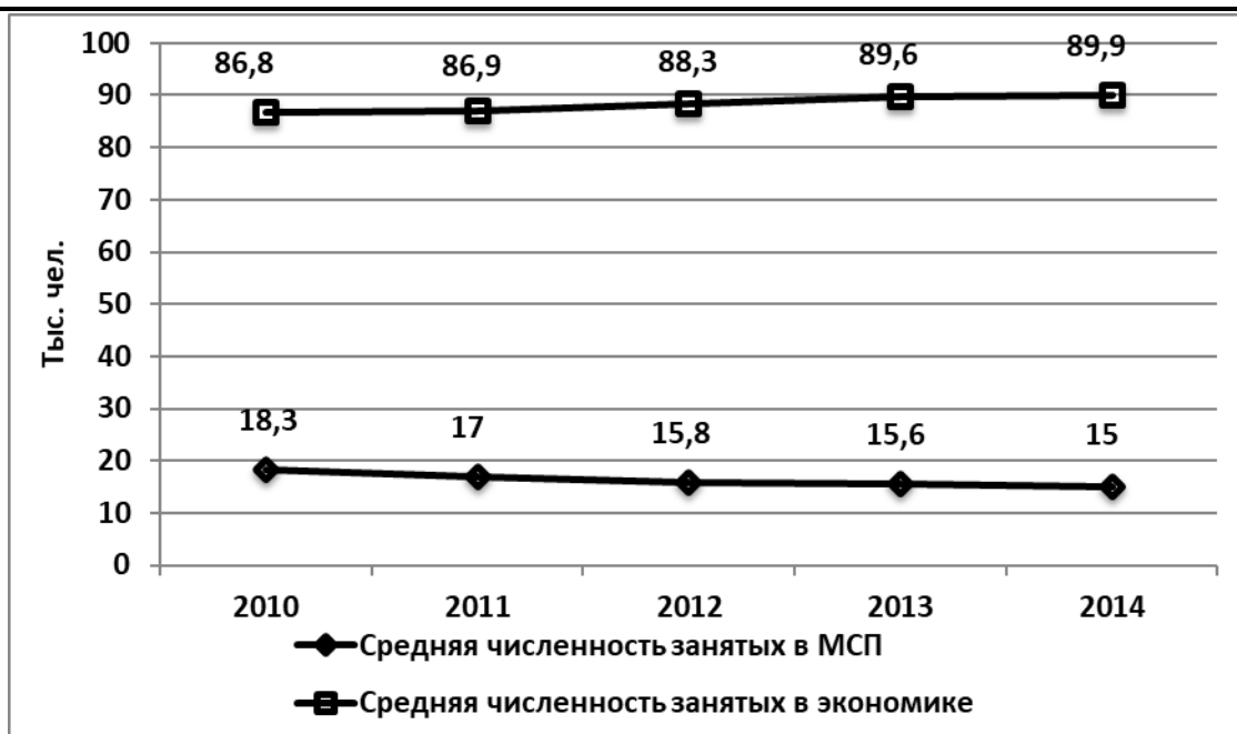
Рисунок 2 - Средняя численность занятых в Магаданской области.

Оборот предприятий малого и среднего бизнеса, приходящийся на душу населения, вырос за анализируемый период на 11% (в сопоставимых ценах).