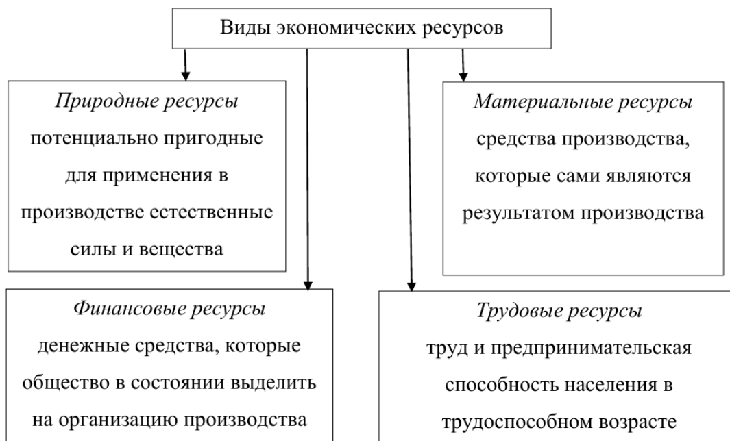
Рисунок 2 – Структура экономических ресурсов

Все предпринимательские ресурсы разноплановы и могут выступать в общей системе, либо в их усеченном варианте при этом различаясь на социальные и экономические. Экономические ресурсы наиболее понятны в интерпретации и могут быть сведены в общую структуру, представленную на схеме ниже (рисунок 2). [Сафонов, 2016, 162]