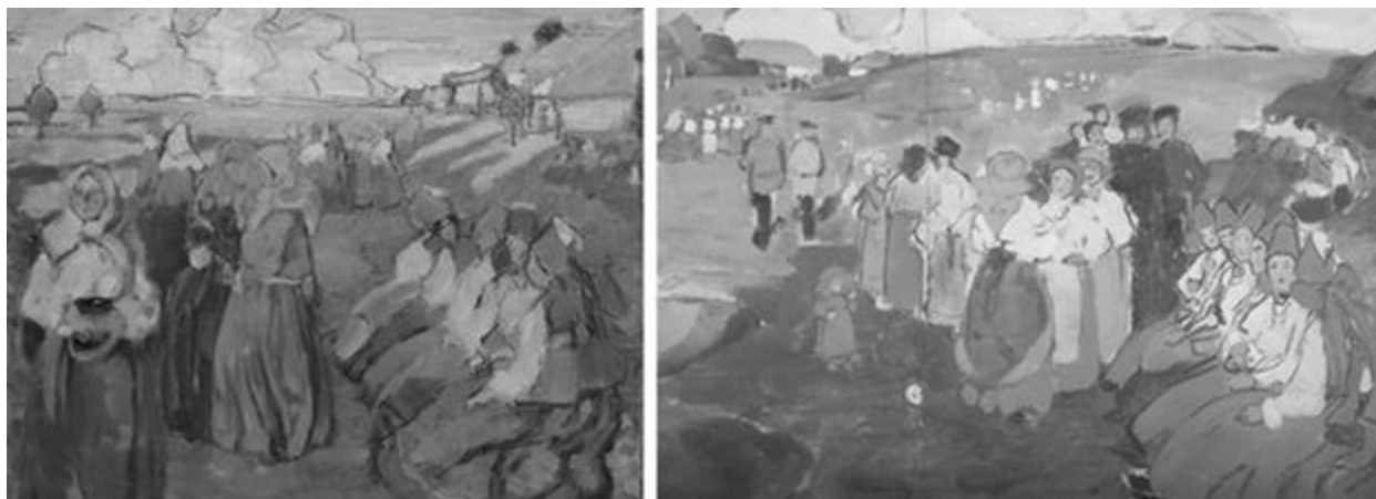
Рисунок 4 – Е.А. Киселева «Невесты. Троицын день» (1907 г.)

[URL: https://turgenevmus.ru/istoriya-odnogo-eksponata-e-a-kiseljova-troicyn-den/ ]