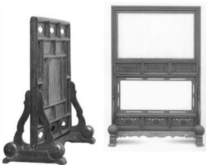
Рисунок 2 – Схема формы ширмы эпохи Мин [Чжао,2016]

Цзымо, 2020, с. 9–10]. Их использовали для придания торжественности атмосфере (например, при входе в залы), для украшения изголовья кровати, а также для тонкого зонирования пространства в жилых комнатах (рис. 2).