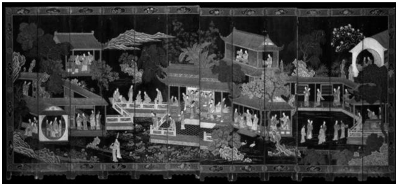
Рисунок 1 – На 12-створчатой ширме изображены сцены из дворцовой жизни. Роспись, лак [Мартынова, Ян Цзымо, 2020]

оставалось демонстрировать высокое положение хозяина: во время официальных церемоний император, например, стоял перед ширмой, обращённой на юг, и она визуально возвышала его фигуру [Чжан В, с. 136].