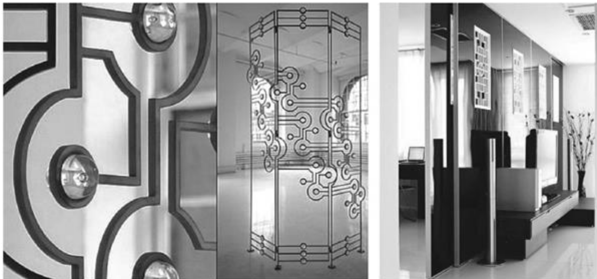
Рисунок 4 – Современная стеклянная ширма [Чжао, 2016]