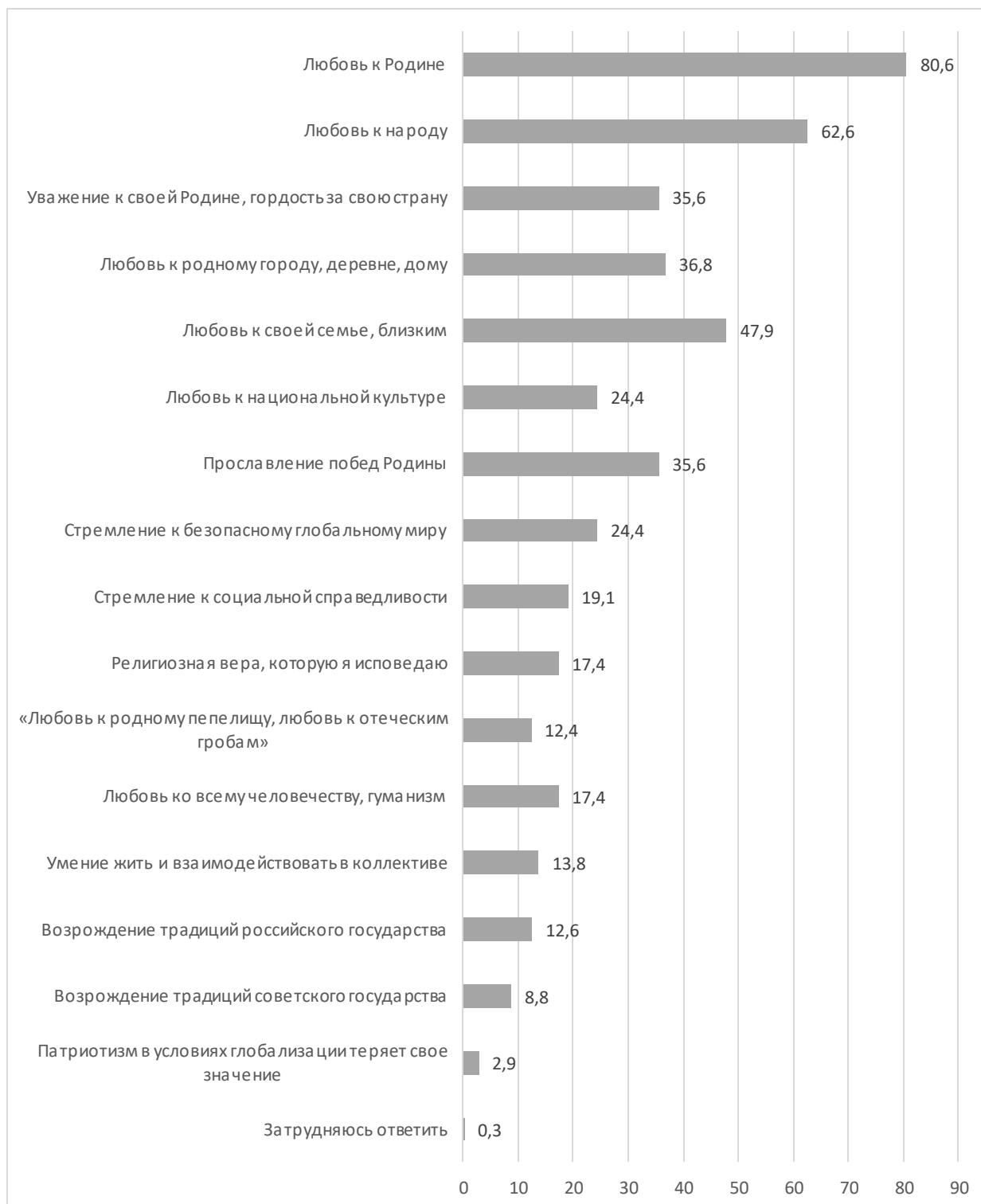
Рисунок 1 – Мнение населения Краснодарского края о том, что такое патриотизм, %

и работать для её процветания, проявляя ответственность, уважение к истории и заботу о будущем. Это нравственный и социальный принцип, связывающий человека с Родиной и выражающий готовность к самопожертвованию ради неё, что актуально в современный исторический период и объединяет народные традиции воспитания с реальной жизнью российской семьи.