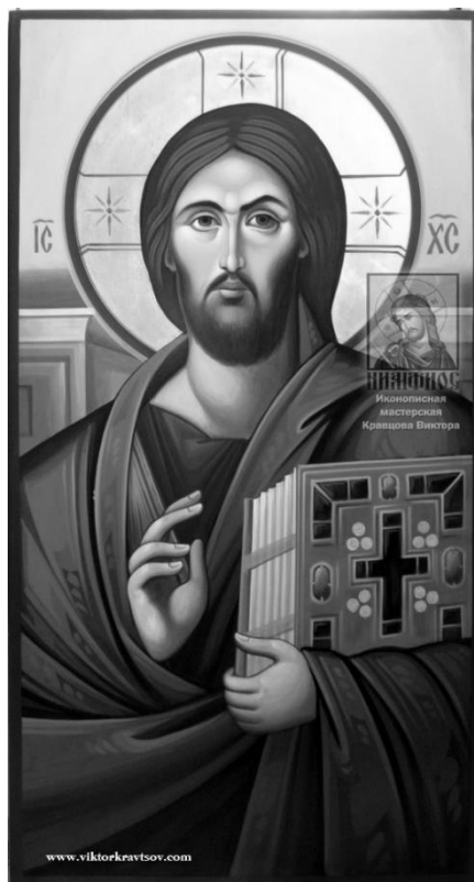
Рисунок 3 - Икона «Спас Синайский» Виктор Кравцов

гармонизованной двойственности заключается потрясающее воздействие иконы. Списки повторяют асимметричность лика-лица, но по силе воздействия протографу нет равных, в этом сыграли свою роль разные факторы: эпоха становления молодой религии христианства, техника энкаустики, и, конечно, гениальность неизвестного византийского иконописца.