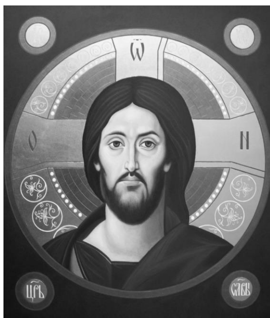
Рисунок 4 - Икона «Спас Пантократор» Муренкова В.Н.